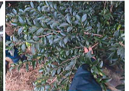
定植から5年目の様子（埼玉県美里町）