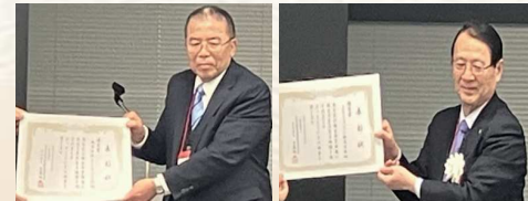
株式会社イーテック24様