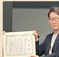
株式会社アグリシSY様

■ 株式会社イーテック24 ■ SKジャパン株式会社 ■ 株式会社アグリシSY ■ 坂本義則二級建築士事務所/BoonDrone ■ 山北調査設計株式会社