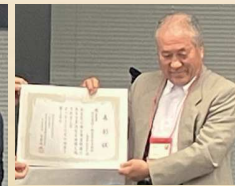
坂本義則二級建築士事務所/BoonDrone様