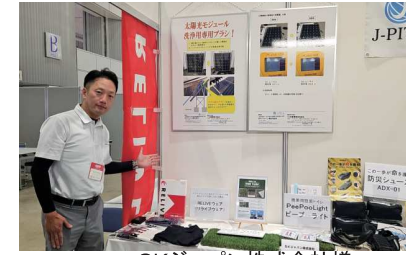
SKジャパン株式会社様