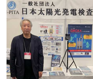
株式会社日本遮蔽技研様