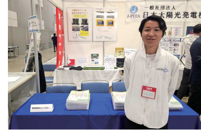
株式会社エンブルー様