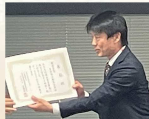
日本地工株式会社様