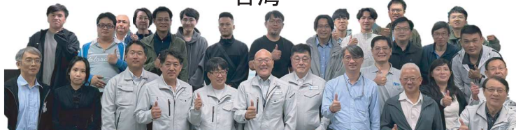
台湾の工業技術研究院(ITRI)様・中華民国太陽光発電システム(PVGSA)様

台湾で初開催となるPV検査技術講習会は、発電施設のある台北の大学をお借りし、30名の受講者で開催となりました。