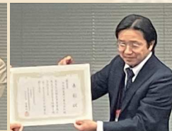
山北調査設計株式会社様